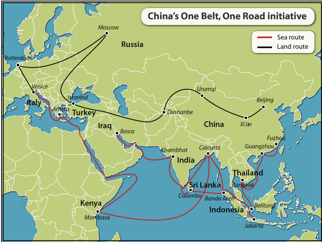
شكل رقم (٢) (خريطة طريق الحرير)

https://www.gisreportsonline.com/chinas-infrastructure-initiative-part-1-implications-for-eurasia-the-us-and-europe,politics,166,report.html